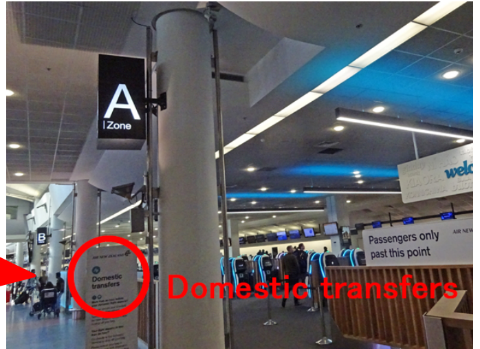
↗ この奥で荷物を預けて下さい。