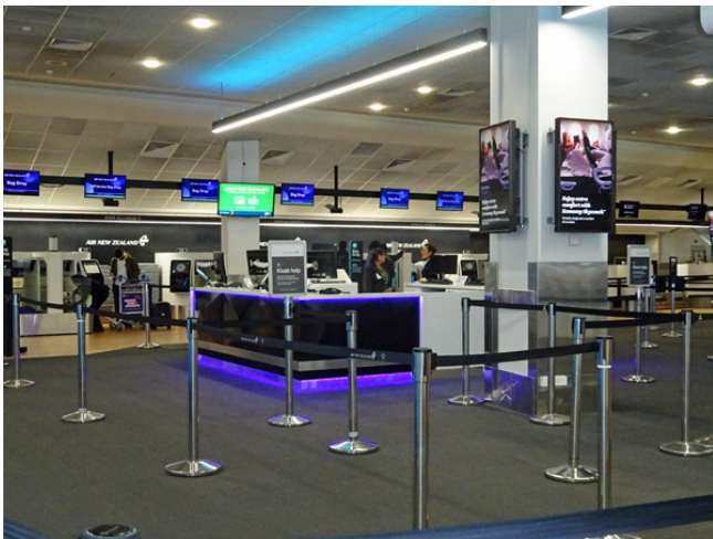
↖ こちらのカウンターで荷物を預けて下さい。

注) 出発1時間前を切ってしまうと、 国内線ターミナルまでご自身で 荷物をお持ち頂く必要があります。